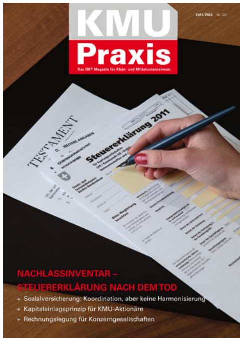
KMU Praxis Nr. 20, Mai 2012