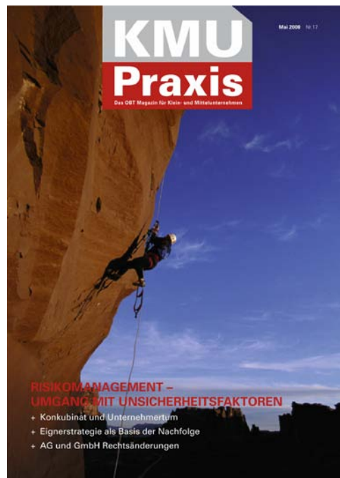
KMU Praxis Nr. 17, Mai 2008