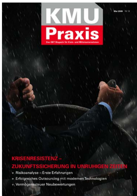
KMU Praxis Nr. 18, Mai 2009