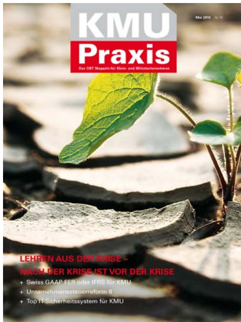
KMU Praxis Nr. 19, Mai 2010