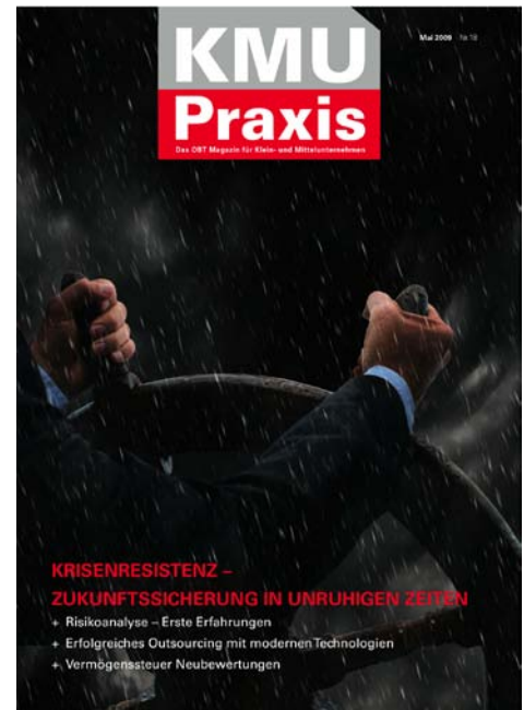
KMU Praxis Nr. 18, Mai 2009