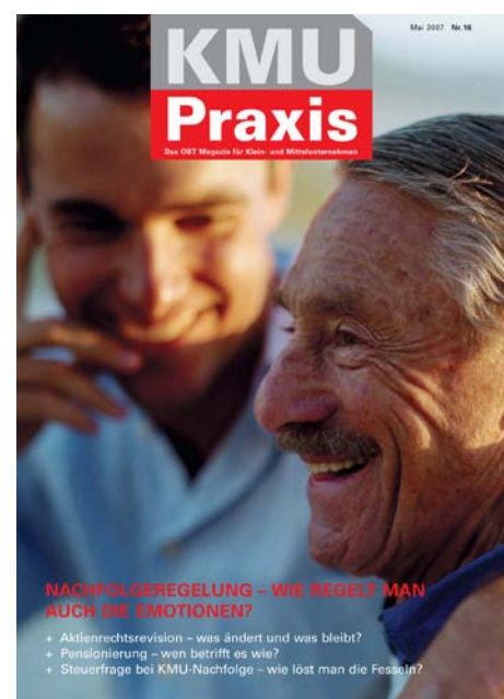
KMU Praxis Nr. 16, Mai 2007