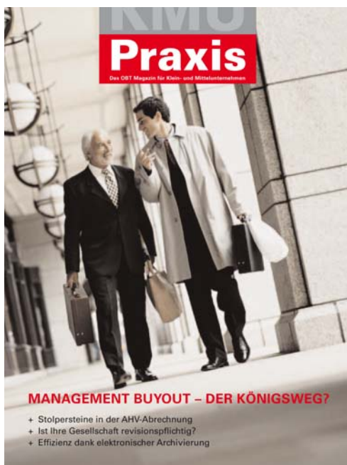
KMU Praxis Nr. 15, Mai 2006