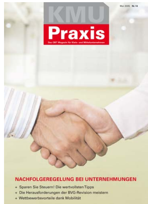
KMU Praxis Nr. 15, Mai 2008