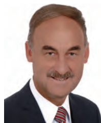
Willi Holdener Wirtschaftsprüfung Zürich