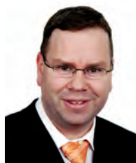
Christian Siegfried Wirtschaftsprüfung St.Gallen

Viele kleinere und mittelgrosse Unternehmen stellen sich die Frage, ob der von ihnen angewandte Rechnungslegungsstandard noch passt: Lohnt es sich, von Swiss GAAP FER auf einen internationalen Standard wie IFRS umzustellen? Welches sind die Vor-, welches die Nachteile? Wohin führt diese Reise schlussendlich?