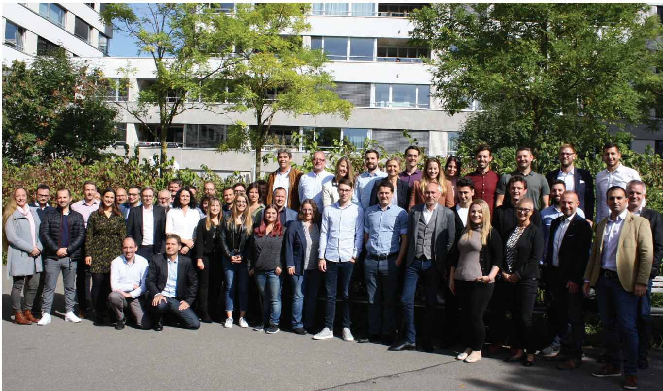
Das Abacus Team bei OBT: rund 60 Mitarbeitende an vier Standorten in der Deutschschweiz

Kunden mit der Abacus Software ein umfassendes Werkzeug für sämtliche Businessprozesse zur Verfügung. Eine gute Software bedingt auch einen guten Implementationspartner. Mit der organisatorischen Fokussierung auf Markt und Produkt begleitet OBT seine Kunden seit diesem Jahr von der Aufnahme der Businessprozesse in Form eines Big Pictures bis zur Nachbetreuung und zum Support mit der jeweils notwendigen Sichtweise.